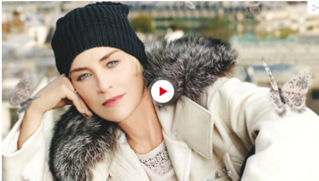
Was für eine Frau: Nicht nur ist Sharon Stone bildhübsch und eine erfolgreiche Schauspielerin. Sie nutzt ihren Ruhm und setzt ein Zeichen im Kampf gegen Aids.

Was das Spendensammeln angeht, hat Sharon Stone (57) echt was drauf. Bereits mehrfach schwenkt die Schauspielerin bei den Galas der Charity-Organisation am den Auktionshammer . Doch während sie bei den Glamour-Events die Gebote von Stars wie Heidi Klum (42), Miley Cyrus (22) & Co. in die Höhe treibt, kann jetzt jeder etwas Gutes tun im Kampf gegen HIV und Aids – und sich dabei fühlen wie ein Hollywood-Star .